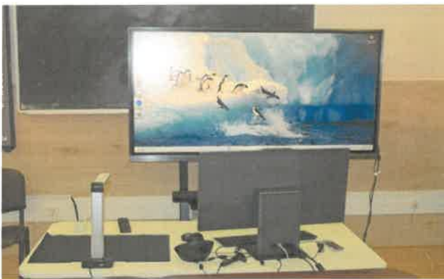
Panciu, județ Vrancea – Trama II